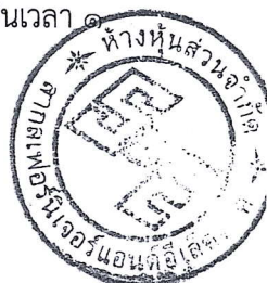
(นายอรุณ วิรุต) หุ้นส่วนผู้จัดการ