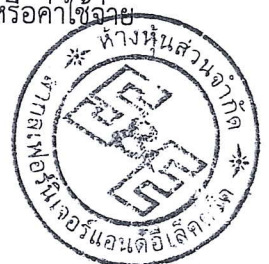
(นายอรุณ วิรุฬหสกุล) หัวหน้าผู้จัดการ