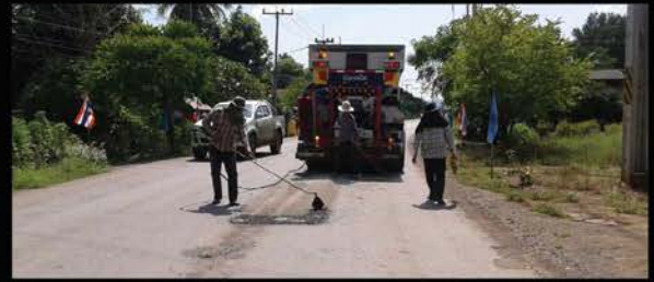
2) สายบ้าน กม. 28 ตำบลดงขุย – บ้านเขาสัก ตำบลตะกุดไร อำเภอนนแดน จังหวัดเพชรบูรณ์ ระยะทาง 6.325 เมตร (6.325 กม.)

องค์การบริหารส่วนจังหวัดเพชรบูรณ์ เข้าดำเนินการซ่อมผิวจราจรลาดยางที่ชำรุดเป็นหลุมเป็นบ่อจากการใช้งาน ซึ่งเป็นถนนที่อยู่ในความรับผิดชอบขององค์การบริหารส่วนจังหวัดเพชรบูรณ์ ในเขตพื้นที่อำเภอนนแดน จังหวัดเพชรบูรณ์ จำนวน 2 สายทาง ระยะทางรวม 6.325 เมตร (6.325) เพื่อบรรเทาปัญหาความเดือดร้อนให้แก่ราษฎรที่ใช้เส้นทางในการสัญจรไป-มา ระหว่างหมู่บ้านและตำบลใกล้เคียง ดังนี้